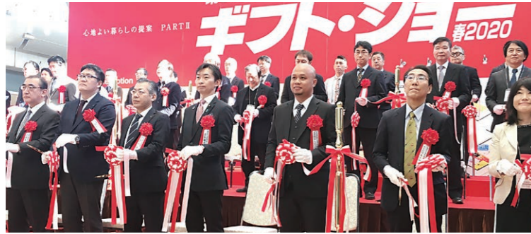
2020.2.5 東京インターナショナル ギフトショー 開会式