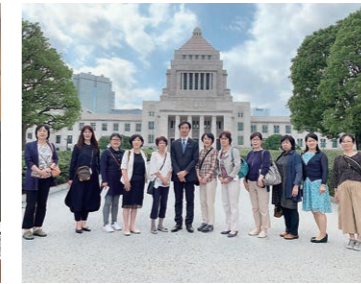
2019.9.26 志賀町商工会(石川県) 女性部のみなさま 国会見学