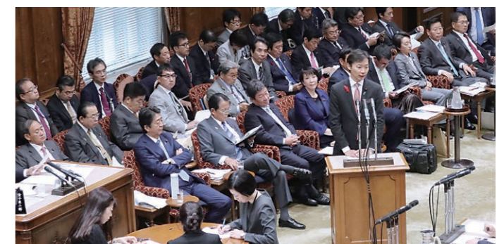
2019.10.16 参議院予算委員会 答弁