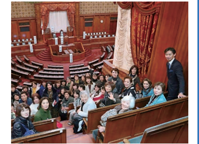
2019.11.26 福岡県商工会女性部 連合会のみなさま 国会見学