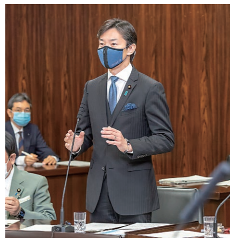
2020.11.24 参議院 経済産業委員会