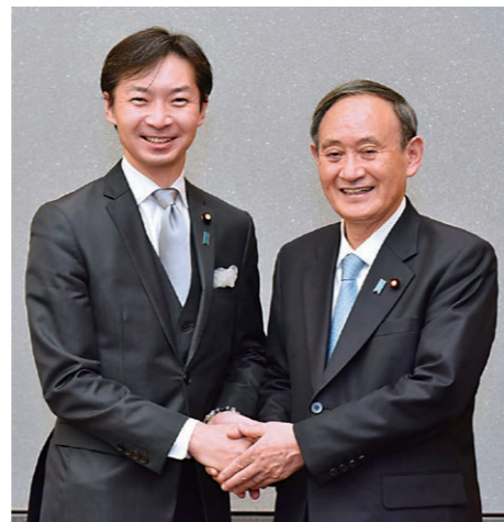
菅義偉 内閣総理大臣

政務官の任が解けても、コロナ禍において国会議員として果たすべき仕事は山積しております。菅義偉内閣総理大臣をお支えするべく、参議院における国会対策副委員長や経済産業委員会筆頭理事としての重要な責務を粛々と遂行し、地域の元気を取り戻すべく、引き続き専心努力してまいります。