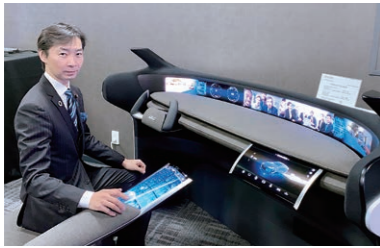
2020.02.20 (株)JORED 視察