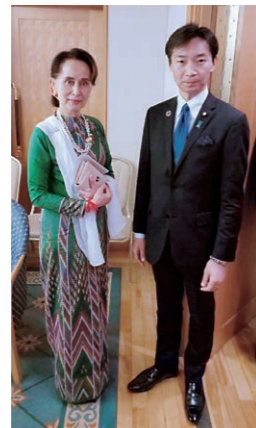
2019.10.21 ミャンマー アウンサンスーチー 国家最高顧問