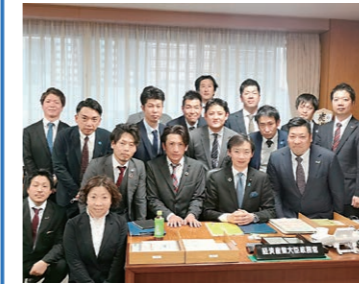
2020.2.18 石川県商工会青年部 連合会のみなさま 経産省政務官室