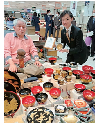
2020.2.25 伝統的工芸品展 WAZA2020 視察