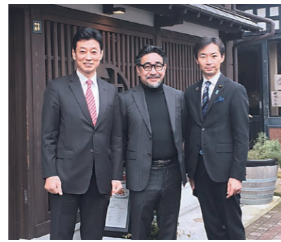
2019.12.8 西村康稔経済再生担当大臣 金沢ワイナリー 視察