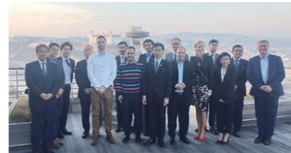
2019.10.23 スロバキア出張 JETROミッション