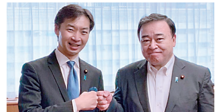
梶山経済産業大臣