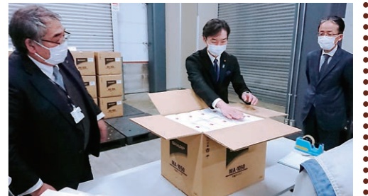
2020.3.30 シャープ三重工場 視察

日本も世界も想定していなかった新型コロナウイルス感染症が猛威を振り出しからは、深刻な影響を受けた地域経済や社会生活を守り支える仕事に集中しました。地域にとって大切な仕事を明日へ繋ぎ、必要な雇用を守るために、我が国で初めてとなる給付金や無利子融資など、多くの支援事業を短期間で具現化し、不安を抱える方々へ確実に支援を届けるために鋭意取り組んでおります。