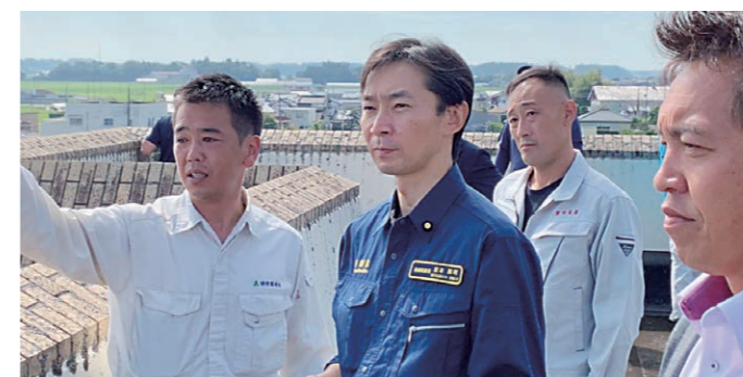
2019.9.23 台風15号 千葉被災地訪問