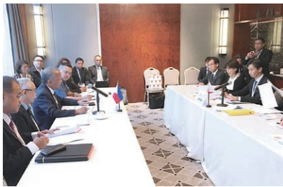
2019.11.27 フィリピン出張 クエアルフォントクシ エネルギー大臣