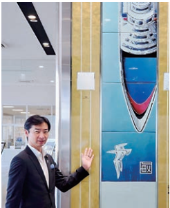
7月30日 金沢港クルーズターミナル