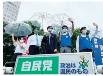
7月4日 自民党石川県連青年局街頭演説会