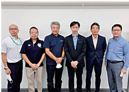
9月13日 いしかわエネルギーマネジメント協会訪問