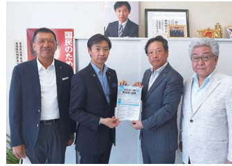
8月4日 北陸税理士会要望