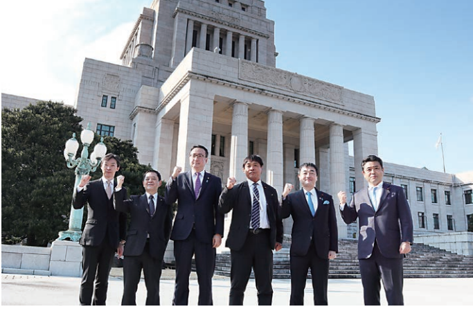
1月18日 通常国会開会式