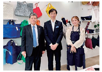
7月9日 ファクトリーショップmono-bo 視察