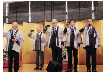
11月16日 地酒で乾杯いしかわ会議