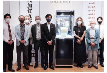
9月10日 現代加賀九谷焼作家展