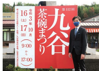
10月16日 九谷茶碗まつり