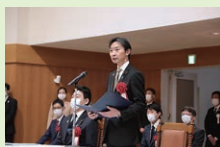
【第151次製造貨幣大試験】

新型コロナウイルスによる影響から我が国の経済を立て直すため、世界的な物価高騰などのリスクへの対応、新しい資本主義の実現、国民を守り抜く外交・安全保障の強化、国土強靱化の推進など、山積する様々な課題や問題に向き合ってきました。