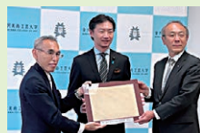
【金沢美術工芸大学視察】