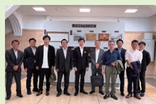
【支援者の皆様と見学】